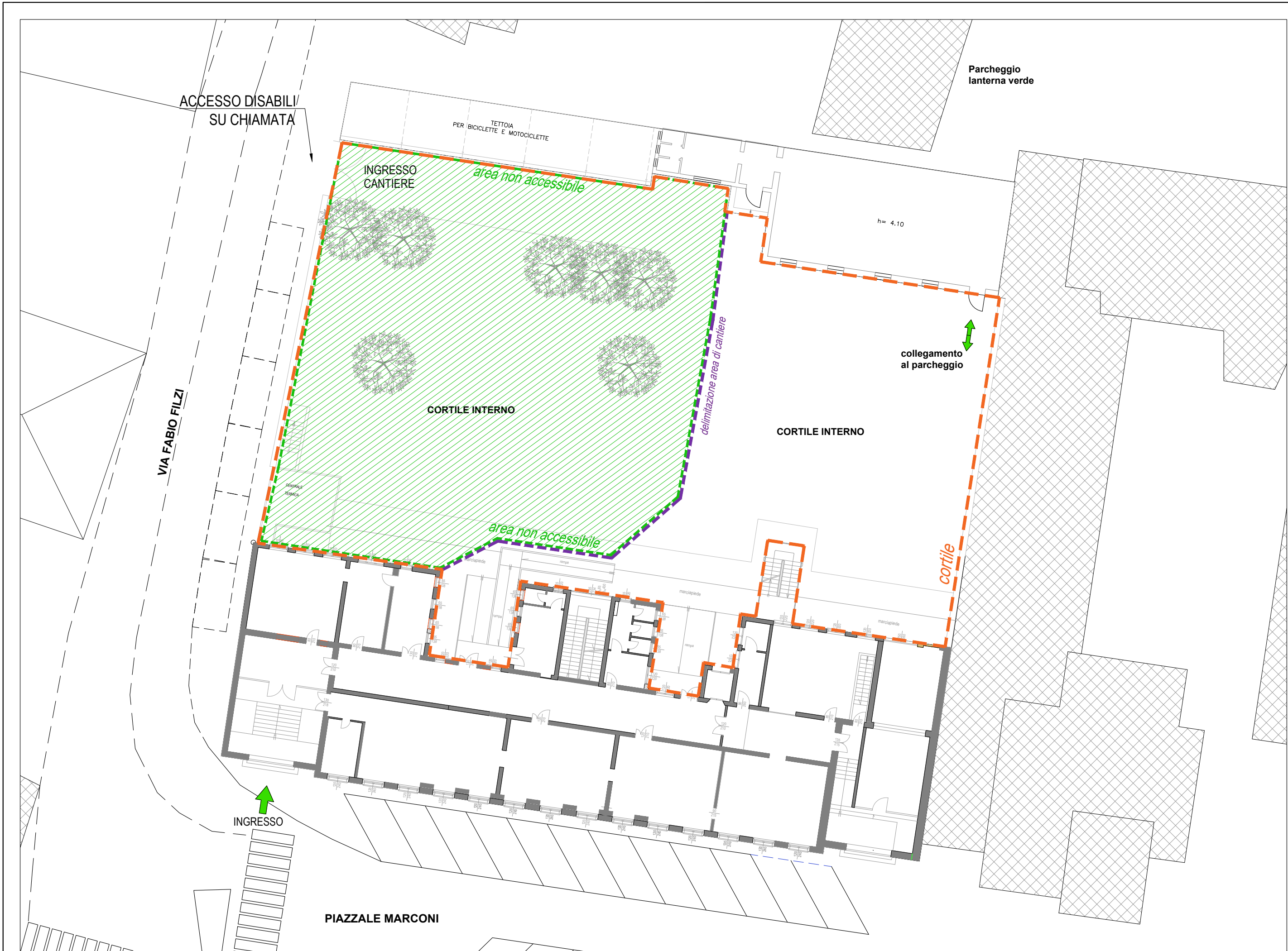
PLANIMETRIA GENERALE - FASE 0 TAGLIO PIANTE - SCALA 1:250

LAYOUT DI CANTIERE CHIUSURA CORTILE PER GIORNI 15-16-17 GENNAIO